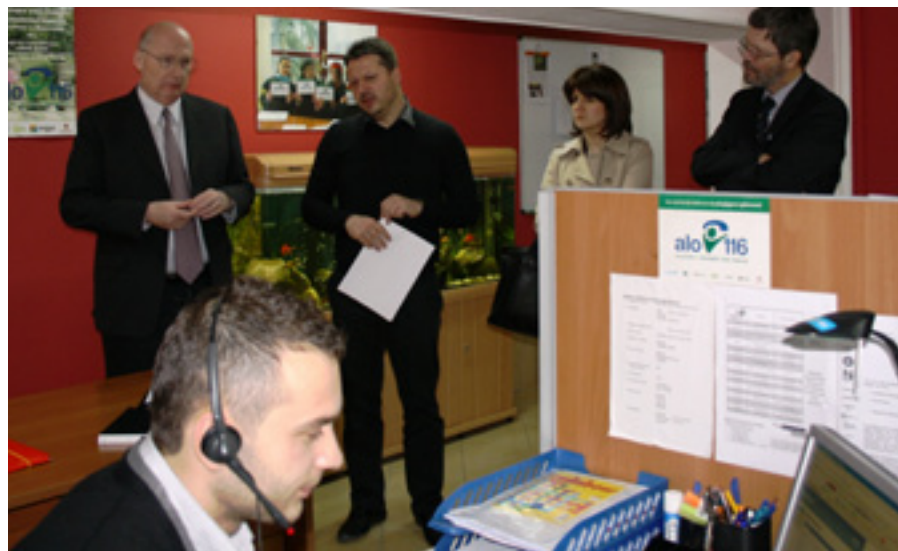
Foto: Vizita e Drejtorit Rajonal të UNICEF për Evropën Qendrore e Lindore dhe Komonuelthin e Shteteve të Pavarura

Drejtori Rajonal i UNICEF-it për Evropën Qendrore dhe Lindore dhe Komonuelthin e Shteteve të Pavarura