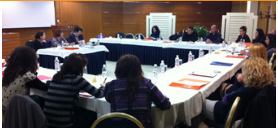
Foto: Seminaret për aspektet juridike të çështjeve të abuzimit/keqtrajtimit të fëmijëve të organizuara nga Prezenca e OSBE-së dhe Ambasada franceze

zhenca, dhuna dhe shfrytëzimi. Përfituesit kryesorë janë shtatë komunitete rome dhe egiptiane në Tiranë, me një total prej 234 familjesh me 530 fëmijë dhe 467 të rritur. Fëmijët dhe familjarët e tyre përfitojnë mbështetje psiko-sociale e juridike, shërbime shëndetësore, ushqime dhe aktivitete edukative. Një ekip i posaçëm punon në komunitete dhe rrugë për të evidentuar rastet e reja dhe për t'i dhënë mbështetje. Qendra ofron shërbime urgjence 24 orë për shumë fëmijë të rrugës.