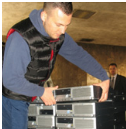
Foto: Prezenca e OSBE-së i jep kompjutera Komisionit Qendror të Zgjedhjeve

Prezenca e OSBE-së në Shqipëri i dha 35 kompjutera Komisionit Qendror të Zgjedhjeve (KQZ) më 30 mars 2011, të cilët do të përdoren për përgatitjen dhe administrimin e zgjedhjeve të 8 majit. Kompjuterat, që do t'i kthehen Prezencës pas shpalljes së rezultateve të zgjedhjeve, do të përdoren kryesisht nga komisionet e nivelit të mesëm, Komisionet e Zonave të Administrimit Zgjedhor (KZAZ) dhe Zyrat Ra-