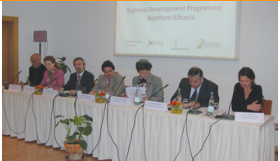
Foto: Lançimi i Programit të Zhvillimit Rajonal për Shqipërinë e Veriut me financim të Austrisë dhe Zvicrës