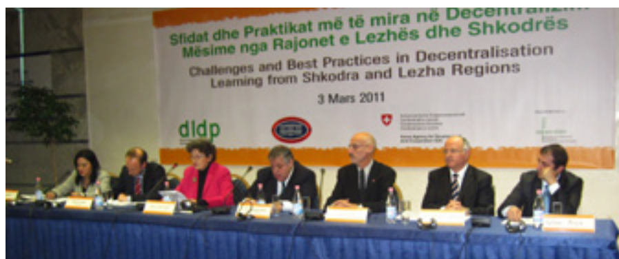
Foto: Konferenca Kombëtare prezanton Përvojat dhe Praktikrat më të Mira të Pushtetit Vendor të Shkodrës dhe Lezhës.