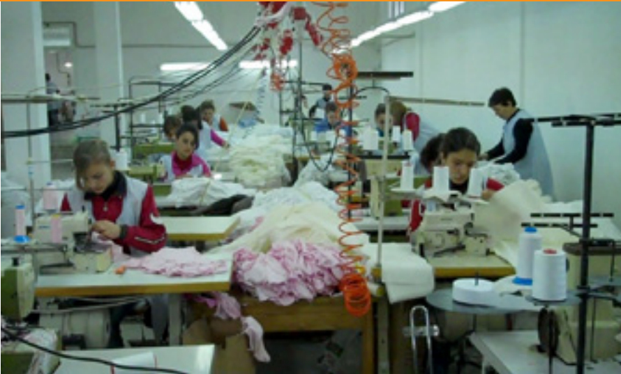
Foto: Një prej kompanive të industrisë së veshjeve e mbështetur nga USAID

kontaktet tregtare dhe të integrohen në rrjete. Muajin që vjen, shoqata e biznesit e kësaj industrie do të lançojë faqen e interneti të Industrisë shqiptare të Veshmbathjeve. Për të parë një nga shoqëritë tregtare që po ndihmohet nga USAID, konkretisht fabrikën e veshmbathjeve “Anisa & Noemi” në Durrës, mund të shihni “Anisa& Noemi” Garment Factory, Durrës, Albania (March 18, 2011) në YouTube USAID/Albania You Tube Channel .