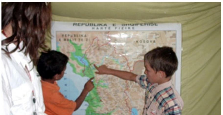
Foto: Fëmijë romë