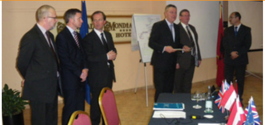
Foto: UMinistri britanik Drejtësisë, Lord McNally mbështet trajnimin e PAMECA III