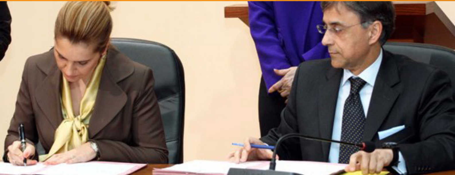
Foto: Ministria e Integritimit, Majlinda Bregu dhe Ambasadori i Delegacionit të BE-së, Ettore Sequi, nënshkruajnë Marrëveshjen e Financimit të IPA 2010