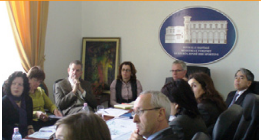
Foto: Grupi Sektorial i Punës për Zhvillimin e Turizmit i ngritur më 4 mars 2011.