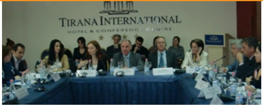
■ Foto: Takim konsultativ për programin operacional të zhvillimit të burimeve njerëzore, mbajtur më 23 mars 2011