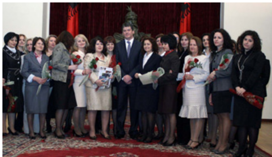
Foto: Rrjeti i grave i mbështetur nga BE i kërkon Presidentit Bamir Topi mbështetje për ekuilibrin gjinor në zgjedhje

jet vendore. Grupi përfaqëson Platformën Kombëtare të Grave, një rrjet informal vullnetar prej 500 grash nga partitë politike dhe shoqëria civile. Ky rrjet është krijuar në kuadër të një projekti 3-vjeçar të Prezencës së OSBE-së për të shtuar pjesëmarrjen e grave në jetën politike dhe publike. Projekti financohet nga Holanda dhe Suedia. Gjatë takimit, përfaqësueset e Platformës i dorëzuan Presidentit një deklaratë ku u bëhej thirrje partive politike, zyrtarëve të zgjedhur, deputetëve dhe institucioneve shtetërore e publike, të respektojnë dhe të përmirësojnë dispozitat juridike për barazinë gjinore, sidomos kuotën 30% të grave për zgjedhjet parlamentare dhe vendore. Gjithashtu, ato kërkuar që kuota të zgjerohet duke u aplikuar edhe në zgjedhjet për kryetarë bashkie dhe në komisionet zgjedhore, dhe propozuan sanksione më të ashpra për shkeljet e Kodit Zgjedhor. Platforma Kombëtare e Grave kërkoj edhe që listat e kandidatëve t’i nënshtrohen debatit publik, para se të miratohen nga Komisioni Qendror i Zgjedhjeve.