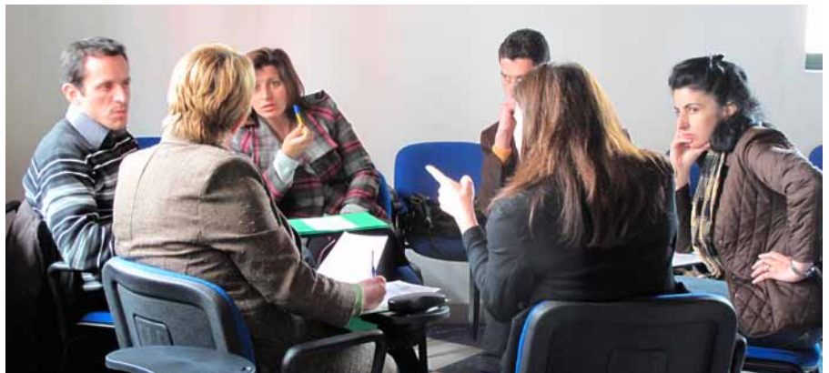
Foto: Staf i projektit IPSIA në takim me përfaqësues të institucioneve të Shkodrës dhe Lezhës duke përcaktuar veprimtaritë e projektit.

Projekti "Risorse Migranti/Migrantët për Zhvillim" i bashkëfinancuar nga Ministria italiane e Punëve të Jashtme dhe e zbatuar nga OJF-të IPSIA ACLI dhe Caritas Italiana, ka shpallur grantin 5 175 000 lekë për të kthyerit që duhet të paraqesin projekte mikro në rrethet e Shkodrës dhe Lezhës. "Risorse Migranti / Migrantët për Zhvillim" synon të forcojë dhe të zhvillojë aftësitë profesionale dhe ndërpersonale që të kthyerit kanë përfutur gjatë përvojës jashtë shtetit, sidomos në Itali. Gjatë vitit 2010, projekti konsolidoi aftësitë profesionale të migrantëve të mëparshëm përmes kurseve profesionale orientuese dhe edukuese si edhe seancave autoriale se si përgatitet një plan biznesi dhe si fillohet një aktivitet ekonomik. Për vitin 2011, projek-