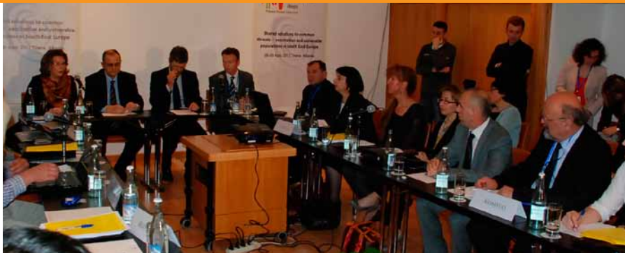
Foto e bërë gjatë konferencës së Evropës Juglindore me rastin e Javës Evropiane të Imunizimit

ia, Greqia, Kroacia, Mali i Zi, Serbia, Maqedonia, Bosnja-Hercegovina, Kosova e Shqipëria, si edhe nga OJF rome nga Shqipëria. Ky eveniment u mbajt në kuadrin e Javës Evropiane të Imunizimit dhe u mbështet nga OBSH dhe UNICEF. Qëllimi i Javës Evropiane të Imunizimit është të rritë ndërgjegjësimin për rëndësinë e imunizimit si edhe të shtojë shtrirjen territoriale të vaksinimit. Vëmendje e veçantë i kushtohet veprimtarive që kanë në fokus popullsitë vulnerabël. Konferenca synonte të krijohej një platformë e përbashkët rajonale që përmban praktikën dhe zgjidhjet më të mira nga vendet e Evropës Juglindore në lidhje me kontrollin dhe parandalimin e përhapjes apo rishfaqjes të sëmundjeve që parandalohen me vaksina. Në fjalën e tij, Ministri i Shëndetësisë, Dr. Petrit Vasili deklaroi: “Ne synojmë t’u ofrojmë të gjithëve shërbime cilësore imunizimi dhe të eliminojmë pabarazitë në përhapjen e sëmundjeve të parandalueshme me vaksina”.