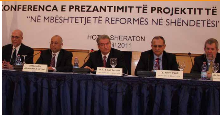
■ Foto: Në fjalën e tij, Ambasadori Arvizu konfirmoi mbështetjen e SHBA për përpjekjet e Qeverisë së Shqipërisë për të përmirësuar qeverisjen në këtë sektor duke ndihmuar në luftën kundër korrupsionit në shëndetësi dhe inkurajoi drejtuesit të zhvillojnë një vizion dhe strategji të qartë për zbatimin e reformave të drejta shëndetësore

5-vjeçar i USAID-it “Mbështetje e Reformës në Shëndetësi” do të rritë aksesin në shërbimet shëndetësore bazë për njerëzit në nevojë si dhe do të mbështesë politikat kombëtare të reformave në shëndetësi. USAID do të punojë me institucionet shëndetësore në Shqipëri: për të përcaktuar më mirë rolet e tyre optimale si dhe një strukturë transparente dhe mirëqeverisëse të sistemit shëndetësor; për të krijuar kodet e sjelljes anti-korrupsion; për të zhvilluar dhe për të zbatuar masat për transparencën dhe përgjegjshmërinë; dhe për të hartuar programe për kufizimin e korrupsionit.