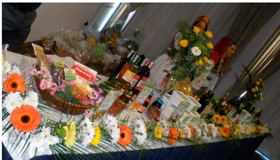
Foto: Punimet e tryezës së rumbullakët me temë “Zhvillimet Potenciale të Industrisë së Veshjeve në Shqipëri”, organizuar nga Dhoma e Fasonistëve të Shqipërisë në bashkëpunim me METE dhe me mbështetjen e GIZ EDEP

Më 15 prill 2011, prodhuesit, përpunuesit, shitësit me pakicë dhe ofruesit e shërbimeve të biznesit shqiptar zhvilluan një takim në Hotel Tirana International