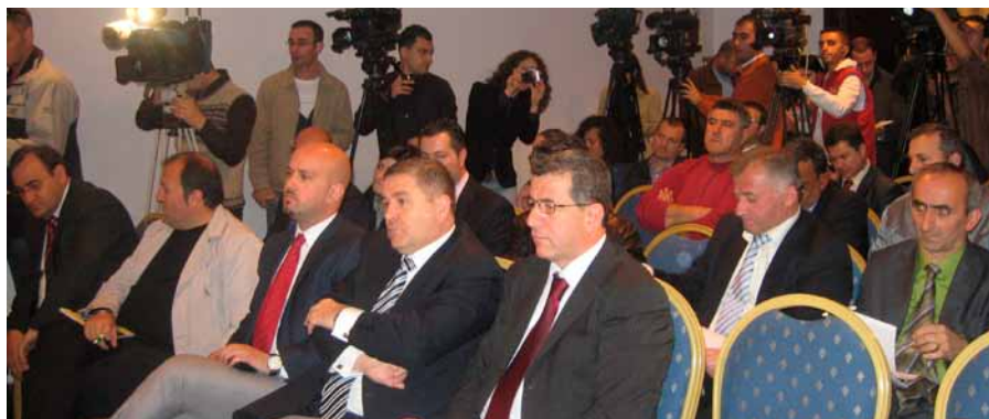
Foto: Punimet e tryezës së rumbullakët me temë “Zhvillimet Potenciale të Industrisë së Veshjeve në Shqipëri”, organizuar nga Dhoma e Fasonistëve të Shqipërisë në bashkëpunim me METE dhe me mbështetjen e GIZ EDEP

i ciklit të mbyllur, zhvillimi i koleksioneve dhe partneriteti me kompani gjermane në industrinë e veshjeve janë ndërhyrjet kyce në të cilat është fokusuar programi. Dhoma e Fasonistëve të Shqipërisë në bashkëpunim me Ministrinë e Ekonomisë, Tregëtisë dhe Energjetikës si dhe me mbështetjen e