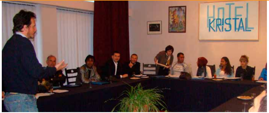
Foto: Diskutime gjatë trajnimit të UNICEF-it

UNDP në Shqipëri bashkoi forcat me Bashkinë e Tiranës, Ministrinë e Punës, Çështjeve Sociale dhe Shanseve të Barabarta dhe Ministrinë e Kulturës, Turizmit, Rinisë dhe Sporteve për të organizuar një seri eventimesh kulturore me rastin e 8 prillit, Ditën Ndërkombëtare të Romëve. Kjo ditë shërben si një mundësi për të kremtuar kulturën romë dhe për të rritur sensibilizimin për vështirësitë me të cilat përballen romët. Aktivitetet ditore të organizuara në parkun Rinia përfshinin muzikë, valle dhe interpretime tradicio-