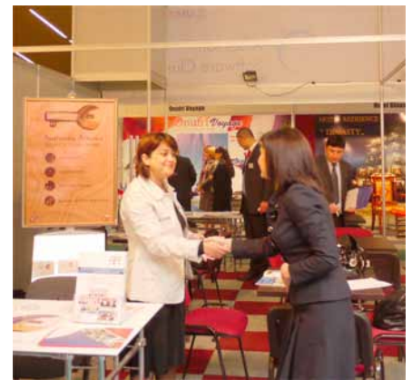
Foto: USAID-i sponsorizoi stendat e dy shoqatave të turizmit dhe të dy shoqatave të teknologjisë së informacionit, për të promovuar pjesëtarët e shoqatave të tyre si dhe për zhvillimin e takimeve mes bizneseve.

Më 14 prill 2011, Ministria e Turizmit dhe Shoqata e Investitorëve të Huaj në