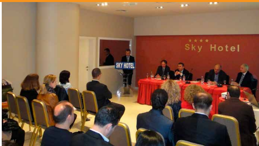
Foto: Aktivitet promovues organizuar nga ASC në bashkëpunim me Universitetin Politeknik të Tiranës dhe me mbështetjen e GIZ

Programi i GIZ “Mbështetja e Zhvillimit Ekonomik dhe Nxtija e Punësimit” (Economic Development and Employment Promotion in Albania - EDEP), ndër sektorë të ndryshëm mbështet edhe industrinë e software-it. Programi implementon një përfaqësim të integruar duke synuar përmirësimin e konkurrueshmërisë së kompanive të IT dhe të software-it. Në qendër të promovimit të industrisë shqiptare të software-it, qëndron Cluster-i Shqiptar i Software-it (Albanian Software Cluster – ASC), i cili ka si qëllim primar promovimin e bashkëpunimit ndërmjet aktorëve kryesorë të