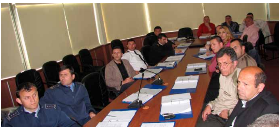
Foto: Trajnim mbi menaxhimin e kufirit blu për institucionet që bashkëveprojnë me QNOD-në

Për zbatimin e strategjisë së trajnimit të QNOD-së (Qendra Ndër-institucionale Operacionale Detare), PAMECA mbështeti organizimin dhe ofrimin e dy kurseve trajnuese në mjediset e Drejtorisë së Përgjithshme Detare në Durrës. Pjesëmarrës ishin përfaqësues të Ministrisë së Mjedisit - Drejtoria e Mjedisit dhe Peshkimit, Ministria e Mbrojtjes - Roja Detare dhe Forcat Ajrore, Ministria e Brendshme - Policia e Kufirit dhe Migrimit, Ministria e Financave - Drejtoria e Përgjith-