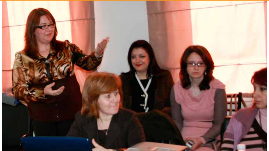
Foto: Takimi i përfaqësuesve të bashkisë Korçë dhe strukturave të tjera vendore më 1 prill 2011

Nga ekzaminimi i kujdesshëm i rasteve individuale dolën zgjidhje krijuese dhe të ponderuara. Në fakt, bazuar mbi