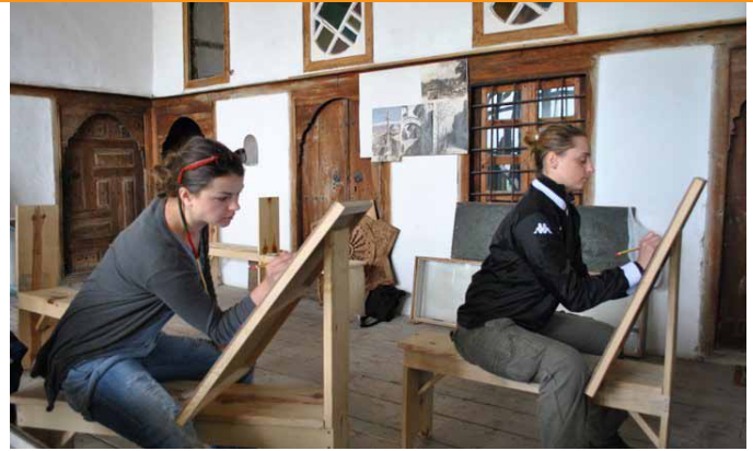
■ Foto: Kampi rajonal i restaurimit i hapur nga "Trashëgimia Kulturore pa Kufi" më 25 prill deri më 7 maj, mirëpritëti 36 pjesëmarrës nga Shqipëria, Bosnjë-Hercegovina, Bullgaria, Franca, Greqia, Italia, Kosova, Rumania dhe Serbia.