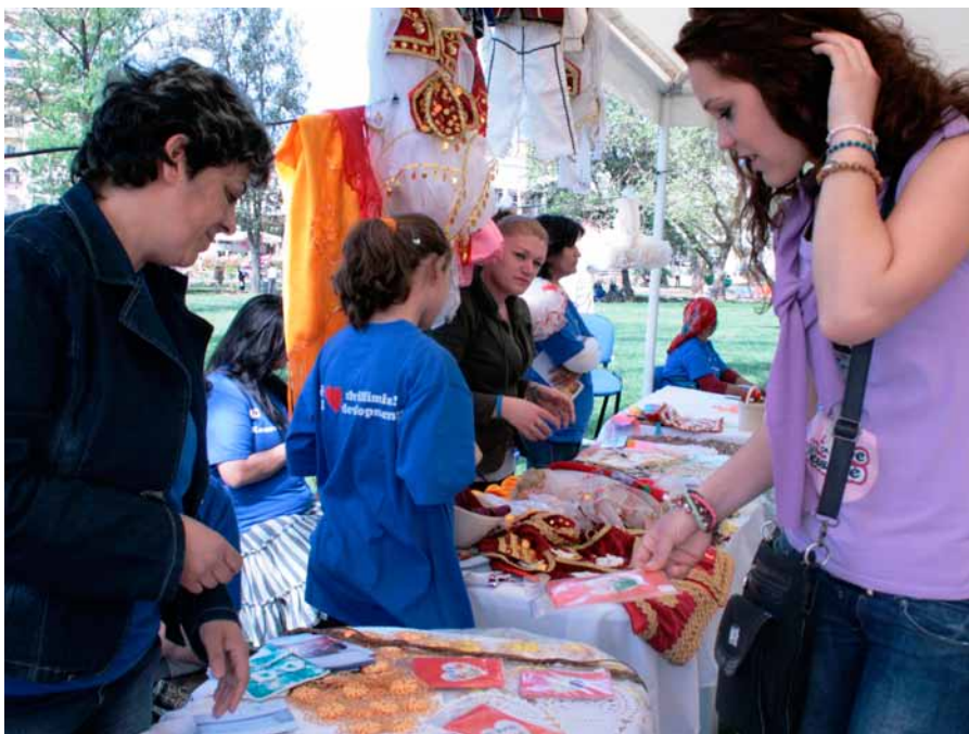
Foto: Një kalimtare në panairin e artizanëve romë në parkun Rinia.

Mbi 100 delegatë morë pjesë në diskutimet e konferencës që theksoi nevojën për të përmirësuar klimën e biznesit dhe rolin e rëndësishëm të partneriteteve publik-privat. Pjesëmarrësit propozuan masa specifike për të përmirësuar turizmin, mjedisin e bizneseve që merren me turizmin (kuadri ligjor turistike, aktet qeveritare dhe tatimet) si edhe mundësitë për të shfrytëzuar pasuri të paluajtmshme për turizmin.