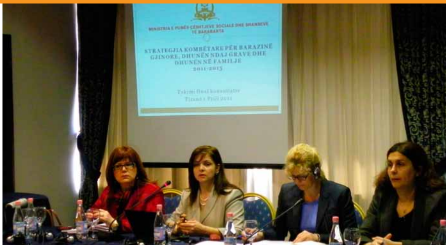
Foto: Takimi i fundit konsultativ për prezantimin formal të draftit të Strategjisë kombëtare të rishikuar 2011-2015, organizuar nga Ministria e Punës, Çështjeve Sociale dhe Shanseve të Barabarta më 1 prill 2011

Para zgjedhjeve vendore të 8 majit, Prezenca e OSBE-së në Shqipëri organizoi një sërë seminaresh trajnimi për gazetarët e rretheve në lidhje me raportimin e zgjedhjeve. Seminaret synonin të ndihmonin gazetarët për të rritur cilësinë e raportimeve gjatë periudhës zgjedhore. Gjatë seminarit, gazetarët në Shkodër,