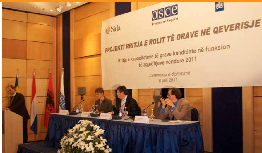
Foto: Ceremonia e diplomimit të grave që përfunduan projektin e trajnimit për kandidatet femra në zgjedhjet vendore