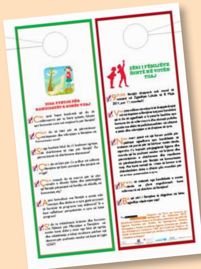
Fletëpalosje e përgatitur nga “Terre des hommes” bashkë me Koalicinin BKTF (Bashkë për Kujdesin Tërësor të Fëmijëve) me mbështetjen e UNICEF-it dhe të partnerëve, për të informuar qytetarët për situatën aktuale, si edhe për zhvillimet në lidhje me respektimin e të drejtave të fëmijëve në Shqipëri.

Zëri i Fëmijëve është në Votën Tuaj ishte slogani i fushatës publike sensibilizuese të lançuar nga shoqëria civile gjatë prillit 2011, në përpjekje për të fokusuar vëmendjen zgjedhore te çështjet e fëmijëve në kohën kur qytetarët shqiptarë u bënë gati të hedhin votën në zgjedhjet e 8 majit. Fëmijët përbëjnë rreth 1/3 e popullsisë së Shqipërisë. Edhe pse nuk mund të votojnë, interesi i fëmijëve në politikën vendore mund të përfaqësohet nga vota e të rriturve. “Terre des hommes” në Shqipëri, bashkë me BKTF (Bashkë për Kujdesin Tërësor të Fëmijëve) dhe me mbështetjen e UNICEF-it dhe të partnerëve të projektit Zhvillimi i Rrjetit të Mbrojtjes së Fëmijëve (CPSN), përgatitën dhe shpërndanë mijëra fletëpalosje në të gjithë vendin për të informuar qytetarët për situatën aktuale si edhe për zhvillimet në lidhje me respektimin e të drejtave të fëmijëve në Shqipëri. Fletëpalosja nxiste ë gjithë votuesve të diskutonin aktivisht për ngurrimin e pushtetit vendor për të ofruar shërbime për fëmijëve dhe krijimin e komuniteteve miqësore për fëmijët. Votuesve u bëhej thirrje që të shtynjë dhe t'iu bëjnë pyetje specifike kandidatëve gjatë fush-