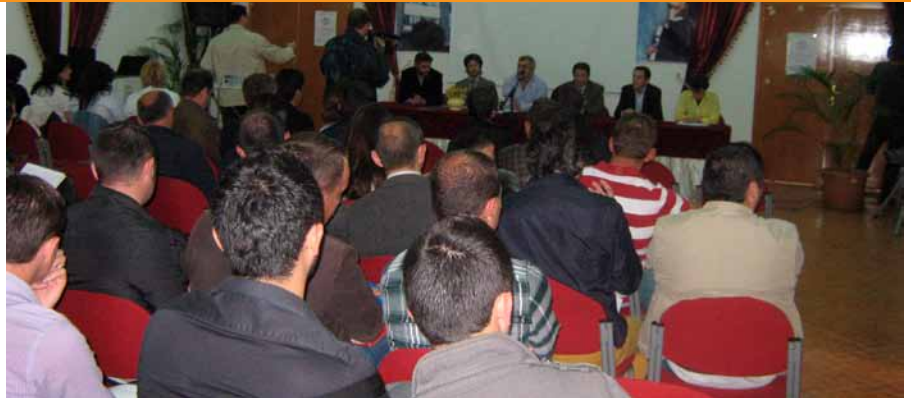
Foto: Të kthyerit marrin pjesë në konferencën e Shkodrës më 29 prill 2011, ku bëhet shpallja e parë për projekt-propozime në kuadrin e projektit "Risorse Migranti".

istria serbe e Bujqësisë, Tregtisë, Pylltarisë dhe Administrimit të Ujërave (konferencën e hapi ministri), Ministrinë e Arsimit dhe Shkencës, Gjykatën e Arbitrazhit për Tregtinë e Huaj (që ka lidhje me Dhomën Serbe të Tregtisë), Bashkia e Beogradit, ICC (që është institucioni më i rëndësishëm për arbitrazhin tregtar), Shkolla Queen Mary e Arbitrazhit Ndërkombëtar, Bashkëpunimi Financiar Ndërkombëtar (IFC), Ambasada e Vendeve të Ulëta, Organizata e Turizmit e Beogradit, disa studio ligjore si Karanovic - Nikolic, White & Case, Wilmer Hale, Moravcevic Vojnovic Zdravkovic (në bashkëpunim me Schönherr), Bojovic, Dasic dhe Kojovic. Me qëllim që të përfitohet përvoja e gjerë e të gjithë rajonit në konferencë dhe në gjyqin e inskenuar, GIZ organizoi edhe një diskutim ku u diskutuan zhvillimet më të fundit në fushën e zgjidhjeve alternative të arbitrazhit si edhe veprimtarive e mundshme për të ardhmen. Në këtë tryezë të rrumbullakët ishin të pranishëm edhe partnerët tanë, UNCITRAL dhe DIS.