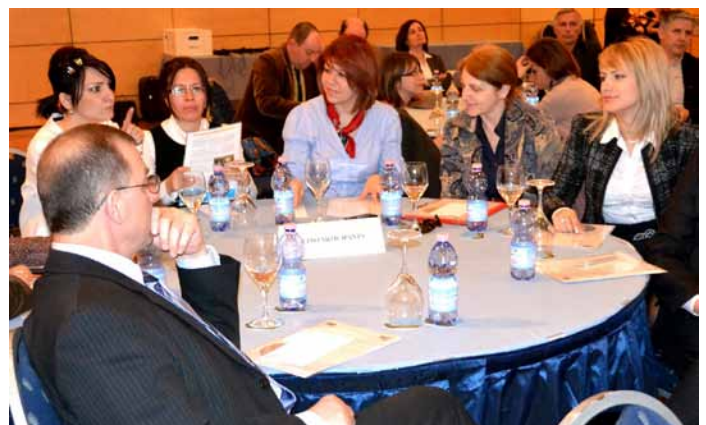
■ Foto: Pjesëmarrës të Programit për Mësim dhe Zhvillim Profesional