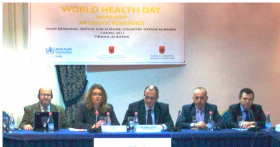
■ Foto: Seminari “Rezistenca ndaj Antibiotikëve” e organizuar më 7 prill 2011 në Tiranë.

Aktualisht, Banka Botërore po financo 15 projekte në Shqipëri në sektorin social, shëndetësi, arsim, burime natyrore, ujësjellës-kanalizime dhe energjetikë, infrastrukturë komunale dhe administrimin e sektorit publik, me qëllimin që ta ndihmojë Shqipërinë të arrijë zhvillim të qëndrueshëm ekonomik dhe social dhe të lehtësojë rrugën e integritit evropian.