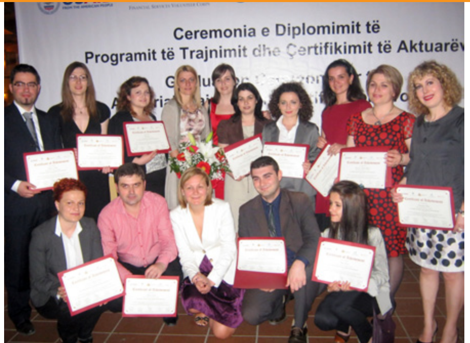
■ Foto: 14 aspirantë për aktuarë morën diplomë dhe certifikim për t'u licencuar si aktuarë profesionistë për të mbështetur sektorin e sigurimeve dhe atë bankar në Shqipëri

Numri i Aktuarëve në Shqipëri dhe Kosovë po vjen gjithnjë në rritje, e