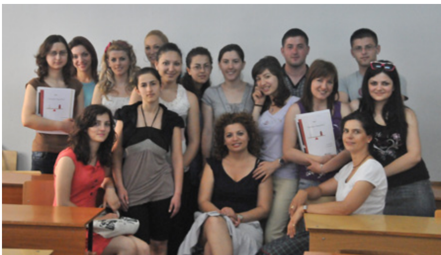
Foto: Studentët e Juridikut në seminarin Barazia Gjinore dhe e Drejt...