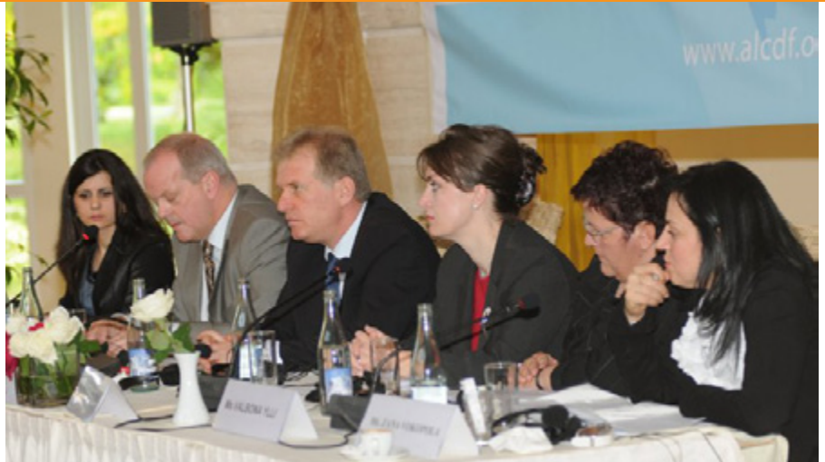
Foto: Ceremonia prezantuese e aktiviteve të ALCDF