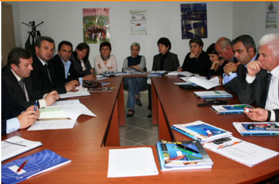
Foto: Tryeza e rrumbullakët me rastin e Ditës Botërore për Sigurinë dhe Shëndetin në Punë.

Më 22 shkurt 2011, projekti i bashkëpunimit ndërmjet Drejtorisë së Përgjithshme të Tatimeve dhe Agjencisë Tatimore Suedeze organizoi një seminar pjesëmarrës me nëpunës tatimore, përfaqësues të ministrive të linjës dhe organizata të shoqërisë civile, për të prezantuar dhe për të diskutuar mbi përfundimet dhe rekomandimet e studimit të kryer në kuadrin e projektit “Sistemi tatimor shqiptar dhe efektet e tij të gratë dhe burrat”. Studimi u prit me interes të larta nga pjesëmarrësit dhe raporti përfundimtar ku përfshihen edhe sugjerimet e tyre, pritet të