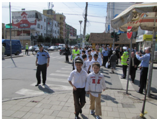
■ Foto: Trajnimi në terren i PAMECA-s për Sigurinë Rrugore