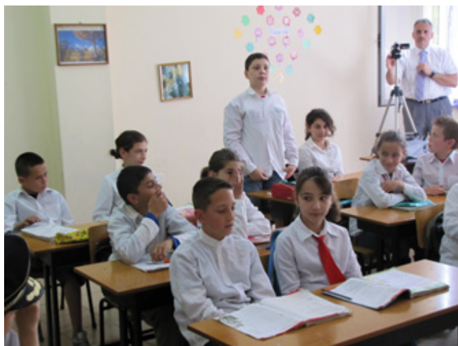
■ Foto: Trajnimi i PAMECA-s nëpër shkollë për Sigurinë Rrugore

Ky trajnim është një kontribut i Delegacionit të Bashkimit Europian në Shqipëri i realizuar nëpërmjet PAMECA III për të ndihmuar Policinë e Shtetit t’u afrohet standardeve të BE-së. Kjo është hera e parë që është e detyrueshme që Drejtoria e Qarkullimit Rrugor e Policisë së Shtetit dhe mësuesit përkatës të organizojnë në shkollë orë mësimi të përbashkëta për edukatën e qarkullimit rrugor; kjo do të pasqyrohet në programet mësimore nga Ministria e Arsimit dhe Shkencës në vitin tjetër akademik. Këto trajnime do të shtrihen në të ardhmen edhe në Policin Rrugore në qarqet e tjera.