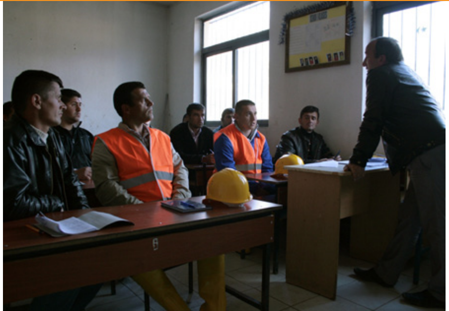
Minatorët nga fshati Vlahna në Kukës duke u trajnuar për sigurinë dhe shëndetin në punë.