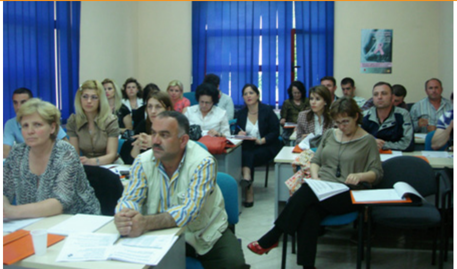
Foto: Programi i Përbashkët UNODC-OBSH trajnon praktikuesit për trajtimin dhe kurimin e varësisë së evidentuar nga droga

jnuar nga Europa, që shërbejnë si kryetrajnues për trajnimet në Shqipëri dhe vende të tjera. Paketa trajnuese e UNODC-it është përkthyer në shqip, me qëllim që të sigurohen rezultatet optimale dhe transferimi i duhur i dijeve.