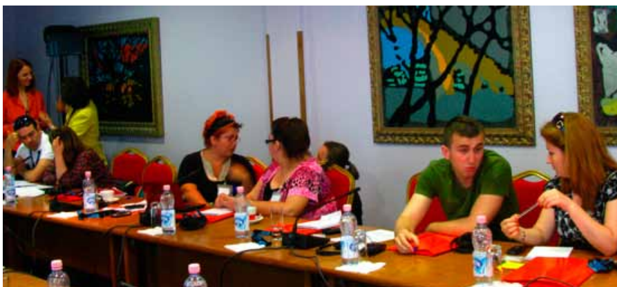
Trajnimi i OJQ-ve lokale - Monitorimi i barazisë gjinore në politika dhe buxhet