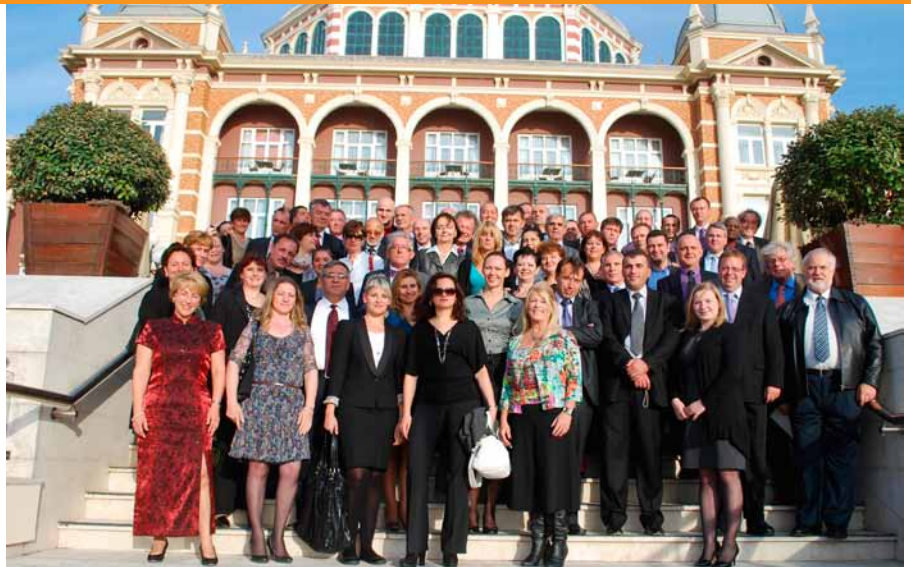
Foto: Konferenca e PRFLB në Hagë, Qershor 2011