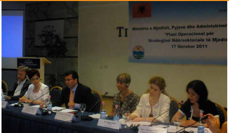
Foto: Konferencë për të prezantuar Planin Operativ për Strategjinë Mjedisore, 17 Qershor 2011

Në Qershor të 2011, Kombet e Bashkuara në Shqipëri prezantuan Raportin e tretë Vjetor të Programit Një OKB në Shqipëri. Raporti thekson rezultatet në të dyja programet dhe procesin e reformave gjatë vitit 2010. Gjithashtu përmban Raportin Administrativ përshkrues dhe financiar të Fondit të Koherencës të Kombeve të Bashkuara. Raporti ka si objekt partnerët kombëtarë dhe ndërkombëtarë të OKB-së, si dhe donatorët që