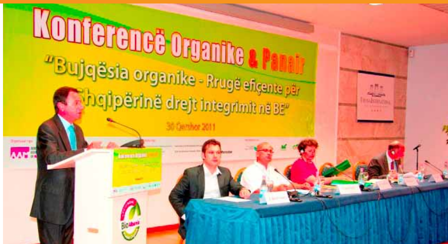
Foto: Ministri i Bujqësisë, Ushqimit dhe Mbrojtjes së Konsumatorit, z. Genc Ruli duke folur në Konferencën Kombëtare Organike në Tirana International Hotel.