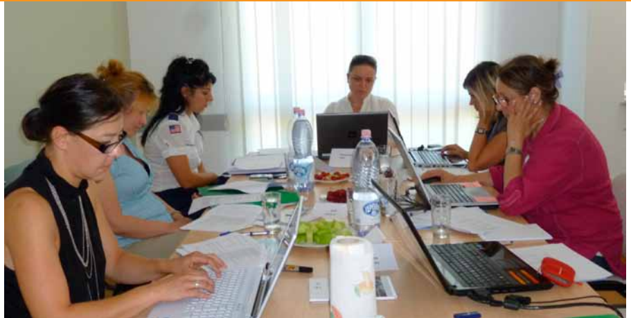
■ Foto: Seanca e përzgjedhjes së fituesve të “Programit për Rrjetin e Biznesit Krijues” nga juria e BNGJ-së, më 23 Qershor 2011

Më 23 Qershor 2011, Zyra e Bankës Botërore në Tiranë shpalli fituesit e Fondit për Shoqërinë Civile për 2011. Fokusi i programit për këtë vit është barazia