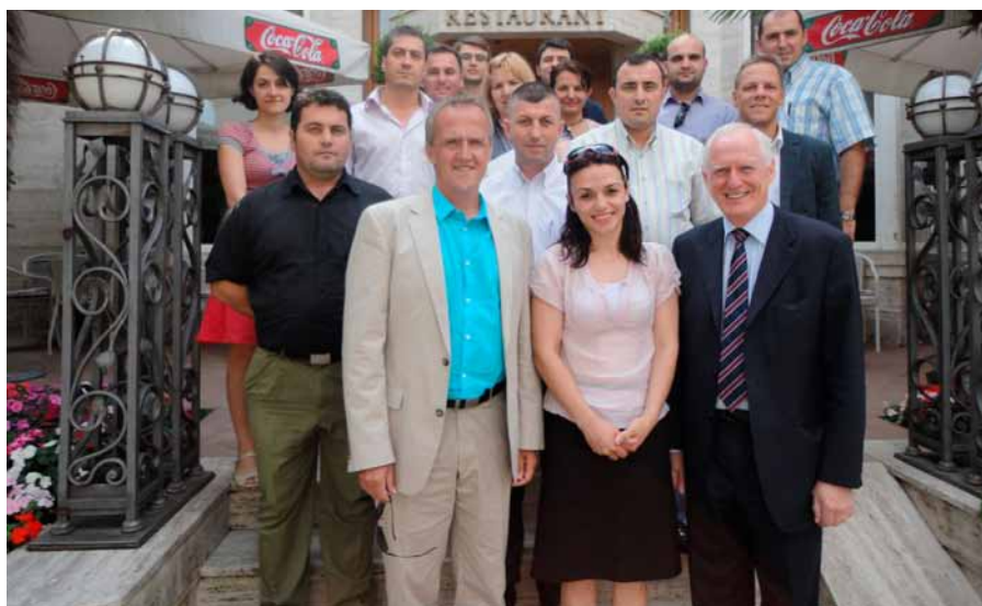
Foto: Pjesëmarrësit e PAMECA-s në Trajnimin për Vlerësimin e Schengen-it, Qershor 2011