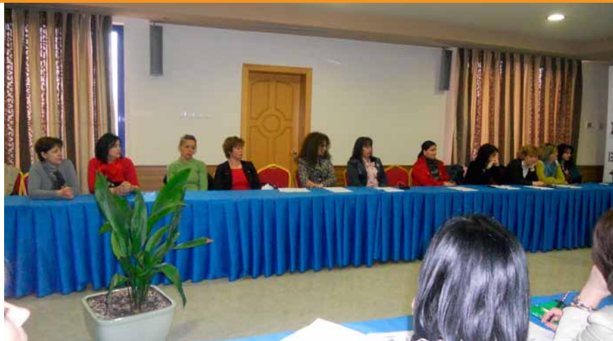
Foto: Takim për themelimin e Rrjetit të Femrës Sipërmarrëse në qarkun e Korçës, organizuar më 18 Prill 2011

Në mënyrë që të vihen në zbatim Standartet Schengen, është e nevojshme që Autoritetet respektive shqiptare të Menaxhimit të Kufijve (Policia kufitare dhe emigracionit dhe Administrata e Doganave) të kenë mundësinë të vlerësojnë zbatimin e Standardeve të kërkuara