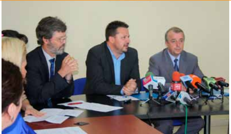
■ Foto: Më 7 Qershor 2011, QMDF në Shqipëri për ALO 116 dhe Drejtoria e Përgjithshme e Policisë, në bashkëpunim me UNICEF Albania nënshkruan një marrëveshje për të përmirësuar bashkëpunimin në gjetjen e fëmijëve të humbur në Shqipëri