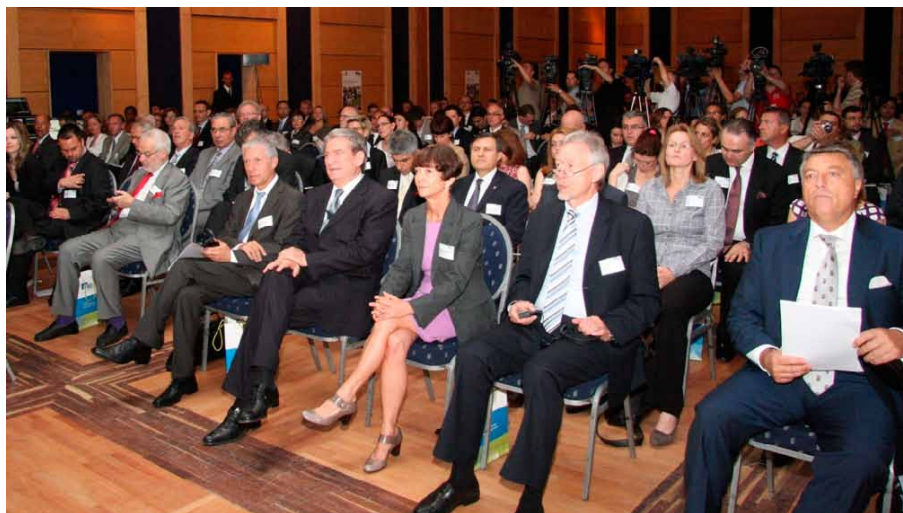
Foto: Takimi Vjetor i Fondit Evropian për Evropën Juglindore (FEEJ) i mbajtur më 6 deri 8 Qershor 2011

Më 6 deri 8 Qershor 2011, më shumë se 300 pjesëmarrës nga rreth 30 vende morën pjesë në Takimin Vjetor të Fondit Evropian për Evropën Juglindore. Banka e Shqipërisë ishte bashkëorganizatore e këtij takimi dhe dha mbështetjen e saj thelbësore nën drejtimin e Guvernatorit të saj, Ardian Fullani. Takimi u hap nga kryeministri, Sali Berisha dhe Guvernatori Fullani, si dhe përfaqësues nga Komisioni Evropian (KE), Qeveria Gjermane dhe KfW. Aspekte dhe mundësi të reja për zhvillimin financiar në Evropën Juglindore dhe Kaukaz pas krizës, me fokus