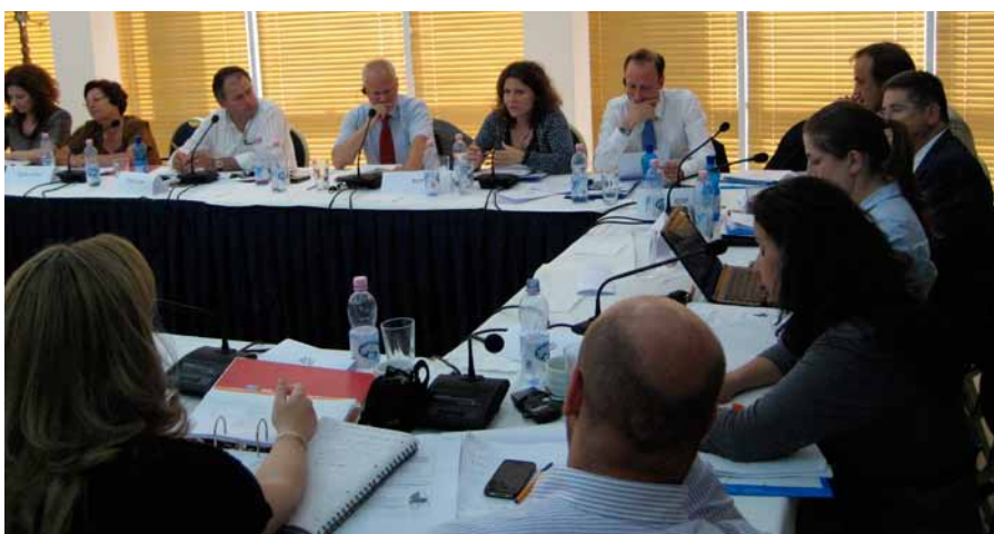
■ Foto: Përfaqësues të qeverisë qendrore dhe lokale, partnerë lokalë dhe të projekteve në qarkun e Shkodrës dhe Lezhës u takuan në Shkodër më 15-16 Qershor 2011 për të kontribuar në seminarin e Programit për Zhvillim Rajonal për Shqipërinë Veriore