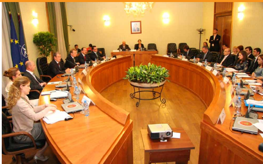
PFoto: Takimi i Komitetit Ndërmintor i Integritimit, i mbajtur më 10 Qershor 2011

Komiteti Evropian nuk ka hasur asnjë rritje në numrin e azil-kërkuesve nga Republika e Shqipërisë pas liberalizimit të vizave. Kjo u konsiderua si një arritje pozitive e cila konfirmon se qytetarët shqiptarë kanë adoptuar një sjellje të përgjegjshme ndaj vendimeve të qeverive të vendeve të Schengen-it. Tema e dytë ku u ndal Komiteti Ndërmintor i Integritimit ishte përmbushja e 12 rekomandimeve të Bashkimit Evropian për aplikimin për anëtarësimin në BE. Që më 31 Janar 2011, qeveria ka hartuar një Plan veprimi dhe këshillimi me KE-në, grupet e interesit, agjencitë në fjalë dhe shoqëri në civile.