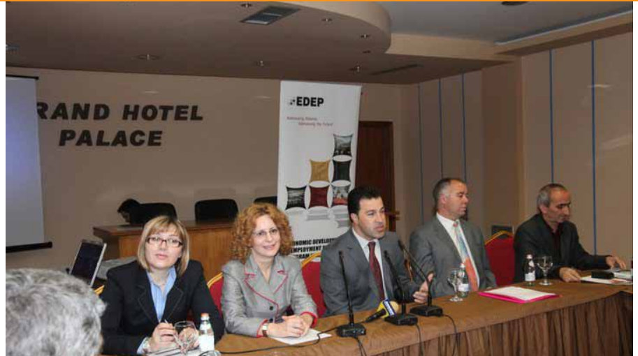
Foto: Konferenca Kombëtare për Qeverisjen Efektive në Zhvillimin e Destinacioneve Lokale Turistike, mbajtur në Korçë më 20 Prill 2011

Në 9 dhe 10 Qershor 2011, UN Women ftoi përfaqësues të OJQ-ve nga Kukësi, Elbasani, Shkodra dhe Tirana, dhe përfaqësues nga Ministria e Punës, Çështjeve Sociale dhe Shanseve të Barabarta për të marrë pjesë në një seminar dy ditor në Ti-