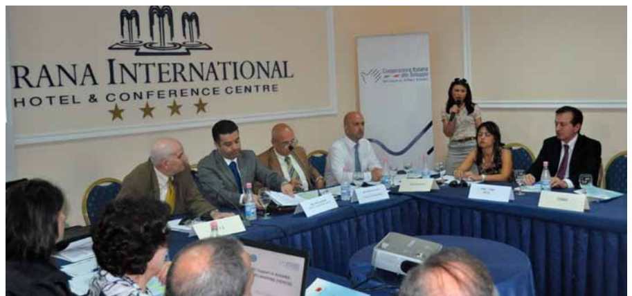
Foto: Diskutime gjatë Forumit të Donatorëve të NVM-ve, 6 Qershor 2011

për Veprim (), dhe Kodit të Sjelljes së BE-së në Plotësimin dhe Ndarjen e Punës në Politikën e Zhvillimit, komuniteti i donatorëve dhe Qeveria Shqiptare janë të angazhuar të harmonizojnë ndihmën dhe ta rradhisin atë ndër prioritetet shqiptare.