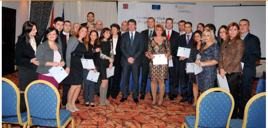
Presidenti Topi dhe Ambasadorja zvicerane me studentët e diplomuar nga Shkolla Shqiptare e Studimeve Politike.