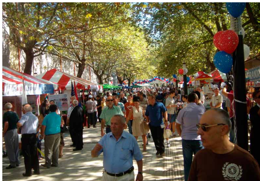
■ Foto: Panairi i Rrugës në Tiranë kremton 20-vjetorin e ringjalljes së miqësisë mes popullit të Shteteve të Bashkuara dhe të Shqipërisë

Lidhjet e forta diplomatike mes Shqipërisë dhe Shteteve të Bashkuara u kremtuan kremtuan në Tiranë më 1 tetor, 2011,