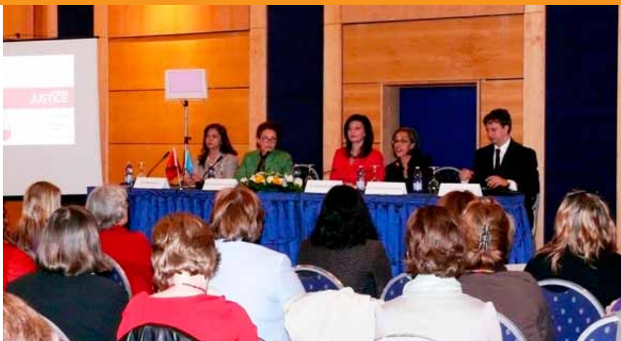
Foto: UN Women paraqiti raportin e parë “Progresi i Grave në Botë: Në kërkim të Drejtësisë 2011-2012” më 21.10.2011 në Tiranë