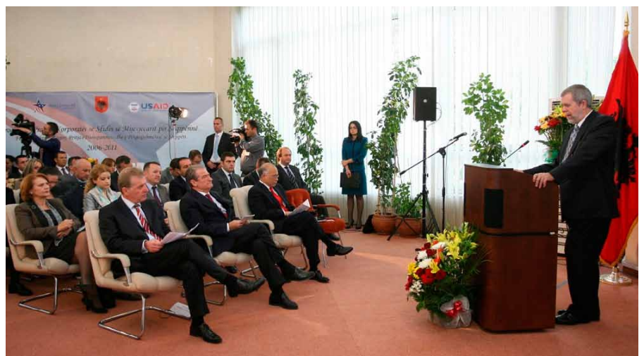
■ Foto: USAID dhe Qeveria shqiptare bashkëorganizuan ceremoninë për kremtimin e sukseseve të arritura nga zbatimi i këtyre programeve në Shqipëri.

Projekti I i Shqipërisë, Pragu i Sfidës së Mijëvjeçarit (2006-2008) përbënte një marrëveshje me vlerë 13,85 milion USD ndërmjet Qeverisë së Shqipërisë dhe Koorporatës së Sfidës së Mijëvjeçarit të administruar nga USAID. Ky projekt ndihmoi qeverinë shqiptare në zbatimin e një sërë reformash me ndikim të lartë me synim reduktimin e korrupsionit dhe