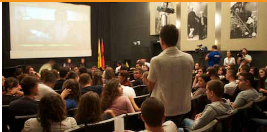
Foto: Edicioni i gjashtë i Festivalit Ndërkombëtar të Filmit për të Drejtat e Njeriut

Më 21 tetor 2011, Agjencia Shtetërore për Mbrojtjen e të Drejtave të Fëmijës, në kuadrin e nismës së Ministrit të Punës, Çështjeve Sociale dhe Shanseve të Barabarta dhe me