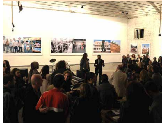
■ Foto: Prezantimi i librit dhe i ekspozitës me titull: "Shqipëria në Tranzicion 1991", e mundësuar me mbështetjen e Zyrës Zvicerane për Bashkëpunim në Shqipëri. Ekspozita qëndroi e hapur nga 22 tetori derimë 6 nëntor.

Autorët së bashku me zv. Drejtoreshën e Zyrës