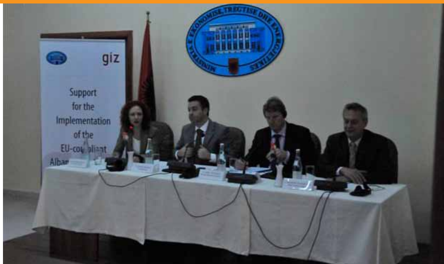
Foto: Takimi prezantues i projektit dyvjeçar të GIZ “Mbështetje për Zbatimin e Legjislacionit Shqiptar të Përafuar me atë Evropian.

EURALIUS është një projekt 30-mujor i financuar nga Bashkimi Evropian i cili ka filluar në shtator të vitit 2010 me qëllim që të përafrojë sistemin shqiptar të drejtësisë në përputhje me standardet e BE-së të transparencës, efikasitetit dhe pavarësisë. Projekti vihet në zbatim nga Ministria Spanjolle e Drejtësisë së bashku me Këshillin e Lartë të Magjistraturës Italiane dhe ka një buxhet prej 2.3milionë €uro. PACA është një projekt 30-mujor i cili ka filluar në shtator 2009 me qëllim përmirësimin e zbatimit të politikave anti-korrupsion në Shqipëri në përputhje me standardet dhe praktikatat më të mira Evropiane dhe ndërkombëtare. Kryesisht ajo është financuar nga Bashkimi Evropian dhe zbatohet nga Keshilli i Evropës nëpërmjet një buxheti prej 2.1milionë €uro.