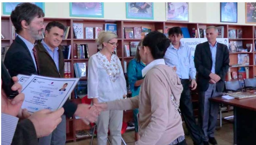
Foto: 57 të rinj nga Kukësi përfunduan një kurs 4-mujor për Studimet Bazë për Punën të kryer nga qendra Don Bosco dhe të mbështetur nga UNICEF në kuadrin e programit të përbashkët të OKB-së për Rininë, Punësimin dhe Migrimin