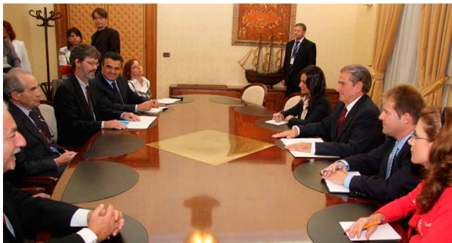
Foto: Vizita në Shqipëri e ish-Ministrit të i Drejtësisë të Francës dhe avokatit të të drejtave të njeriut, z. Robert Badinter