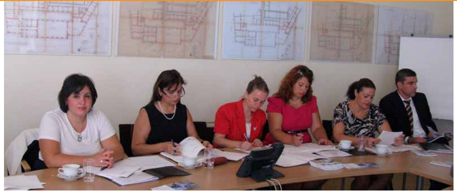
Foto: Vizitë studimore 3-ditore në Vjenë të Austrisë për nëpunësit shtetërorë, organizuar nga UN Women Albania në bashkëpunim të ngushtë me Agjencinë Austriake për Zhvillim

Falë shkollës verore, këshilltaret patën një mundësi të mirë për të përvetësuar aftësi të reja