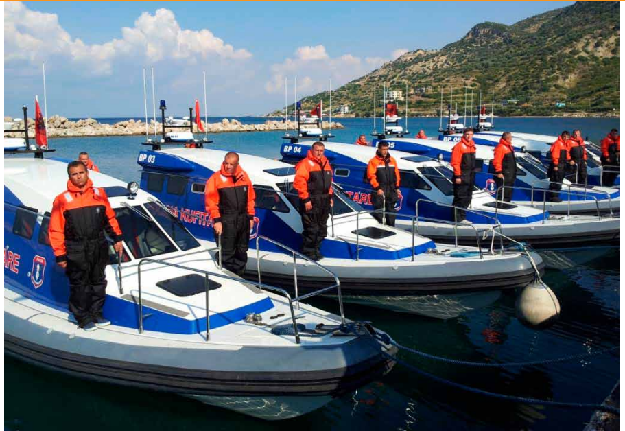
Foto: Ceremonia e dhurimit të 7 mjeteve të reja lundruese Policisë Kufitare dhe Migracionit, të financuar nga BE-ja, dhe përirimi i godinës së re të Njësisë Delta Forcë të financuar nga Ceveria Shqiptare