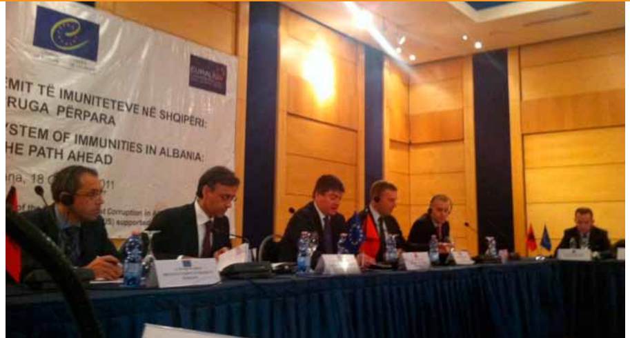
Foto: Konferenca për reformimin e sistemit të imuniteteve në Shqipëri: Rruga përpara, organizuar më 18 tetor 2011

Një konferencë e nivelit të lartë mbi reformën e imuniteteve në Shqipëri u zhvillua më 18 tetor 2011 në Tiranë, me pjesëmarrjen e Presidentit të Republikës, autoriteteve të nivelit të lartë ekzekutiv, anëtarëve të Parlamentit, të gjyqësorit, ekspertëve ndërkombëtarë dhe shoqërisë civile. Konferenca u organizua nga dy nismat e financuara prej BE-së, 'Projekti për Anti-Korrupsion në Shqipëri' (PACA) dhe 'Projekti i Konsolidimit të Sistemit të Drejtësisë' (EURALIUS), nisma këto që që të dyja propozojnë ngushtimin e imunitetit të zyrtarëve të zgjedhur dhe gjyqtarëve në Shqipëri. Imunitetet e zyrtarëve të zgjedhur dhe gjyqtarëve qëndrojnë në themel të reformave të nevojshme për të forcuar sundimin e ligjit dhe luftën kundër korrupsionit në Shqipëri, dhe në këtë mënyrë për-