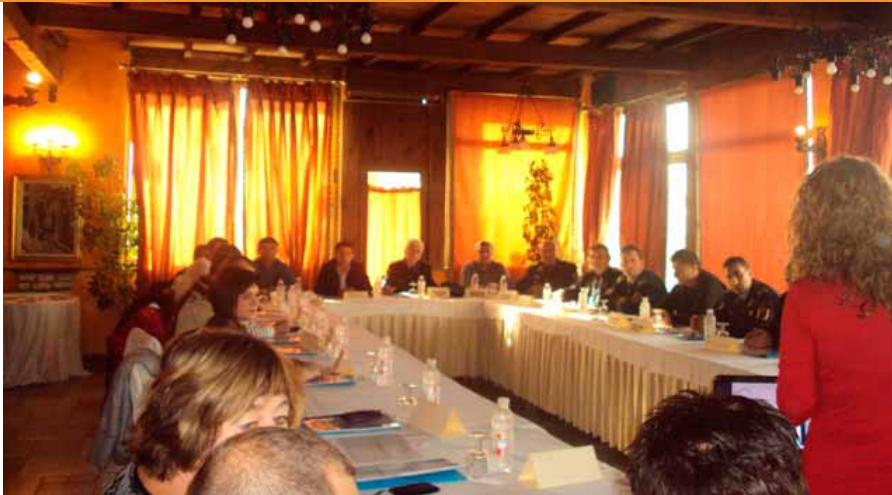
■ Foto: Trajnim i personelit penitenciar për të miturit i zhvilluar nga UNICEF

kuadrin e veprimtarive më të gjera të Prezencës që synojnë të fuqizojnë kapacitetet e Njësisë për Mbrojtjen e Fëmijëve. Ky projekt po zbatohet falë mbështetjes së Qeverisë franceze e cila prej shumë vitesh ndihmon në zbatimin e projekteve në fushën e mbrojtjes së fëmijëve në Shqipëri.